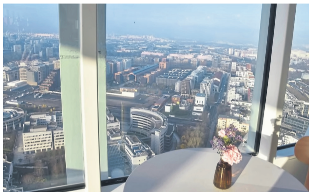
Die Skybar The Stage im 40. Stock der Tour Pleyel bietet einen weiten 360-Grad-Panoramablick über Paris.