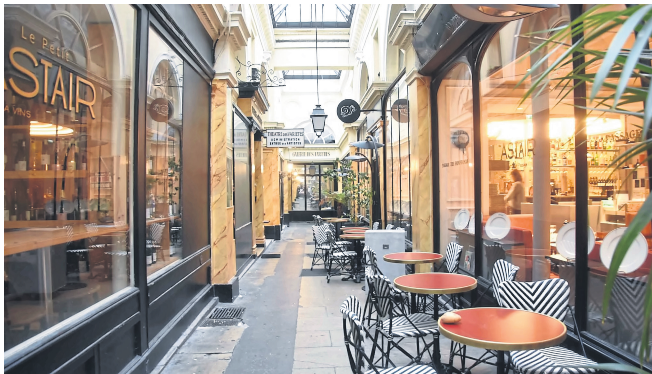
Französisch: Das Restaurant Le petit Stair.

Szenenwechsel ins Saint-Denis seit der Olympiade: Die Skybar The Stage im 40. Stock der Tour Pleyel bietet einen weiten 360-Grad-Panoramablick über Paris. Zum Greifen nah die Kuppel von Sacré-Coeur, der Eiffelturm, am Horizont die Tour Montparnasse. Der Blick schweift über das frühere E-Werk, das Luc Besson, Regisseur von „Im